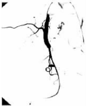
图 1 用 3 枚直径 5 cm×8 mm 钢圈行近瘤口栓塞后的髂内动脉左前 16°造影,可见臀上动脉闭塞,瘤内未见造影剂进入。

复查未探及血流信号。2 周后右臀部已无明显肿胀不适,右股四头肌肌力 V 级,右拇趾背伸肌力 III 级,能自主下地活动,治出院。反复追问病史,忆发病前半年有从楼梯跌落史。1 年后当地医院复查 B 超提示鸡蛋大小盆腔肿块,自诉除右腿肌力尚不能完全恢复外,无其他不适。