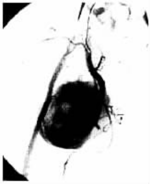
图 1 用 2 枚直径 5 cm×4 mm 钢圈行远端瘤口栓塞后的髂内动脉左前 16°造影,清晰显示近端瘤口及其他髂内分支。

9.0 cm×7.6 cm 大小囊袋样动脉瘤影,其内造影剂存留,瘤口近端及远端显示清晰,其他髂内动脉的脏支受压、显影浅淡,诊断为右臀上动脉假性动脉瘤。导丝帮助下,5FCobra 导管超选至瘤口远端后使用 2 枚直径 5 cm×4 cm 钢圈栓塞(图 1),然后导管退至近端,改变投照角度后,用 3 枚直径 5 cm×8 mm 钢圈中能接近瘤口予以栓塞,10 min 后右侧髂内、外动脉造影见瘤体血供完全消失,髂内动脉的多脏支血管重新显影(图 2)。术后患者症状逐步缓解,6d 天后超声